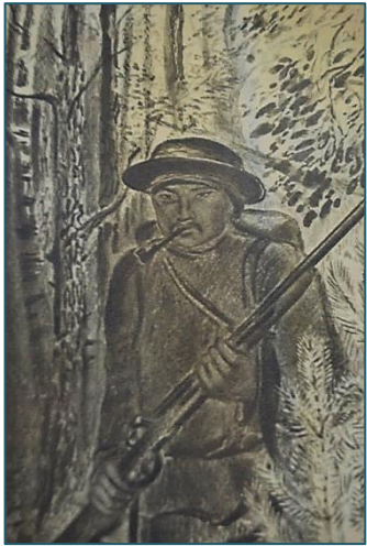
На рис. Дерсу Узала

Арсеньева начал открываться Дальний Восток. Конечно, песни о штурмовых ночах Спасска и волочаевских днях, о приамурских партизанах, трёх танкистах вместе с именами Сергея Лазо, Александра Фадеева, Никиты Карацупы, Полины Осипенко и т. д., озеро Хасан с сопкой Заозёрной – были на слуху. Само время породило всеобщий интерес к романтическому и героическому краю. Он казался загадочным, недостижимым, почти нереальным. Представлялся географической картой. Вот большая страна, и на правом её краю, там далеко-далеко, где из-за синего моря-океана поднимается солнце, раскинулась необыкновенная земля, и живут необыкновенные люди. После одного и другого прочтения отцовской «Притчи» душе явилась если не любовь, то горячее, ясно осязаемое предчувствие любви к этой земле, к этим людям. Первыми среди них стали Владимир Арсеньев и Дерсу Узала.