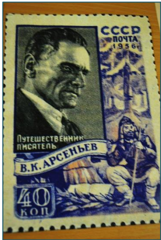
Почтовая марка «Путешественник писатель В.К. Арсеньев»

Счастье, выходит, широко, многоохватно, безмерно. Оно не поддаётся краткому определению, не имеет жёстко очерченных границ, не сводится к одному конкретному образу. И никто заранее не знает, где оно живёт, где его искать. Об этом у Алексея Фатьянова и Василия Соловьёва-Седого: «...Дорога, дорога /Нас в дальние дали зовёт, /Быть может, до счастья осталось немного, /Быть может, один поворот... /Глаза твои искрятся смехом, /Но мимо проходит мой путь, /Быть может, я счастье проехал, /И нужно назад повернуть?..».