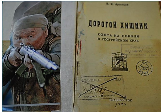
«Возвращение Дерсу Узала. Фотокнига»