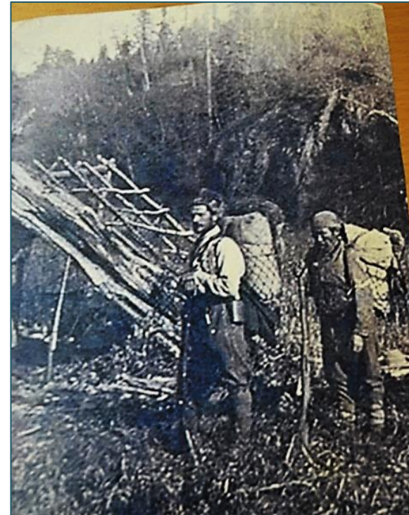
Фотография В.К. Арсеньева и Дерсу Узала

будут, каждый по-своему, продолжать его дело или, как минимум, благодарно помнить о нём.